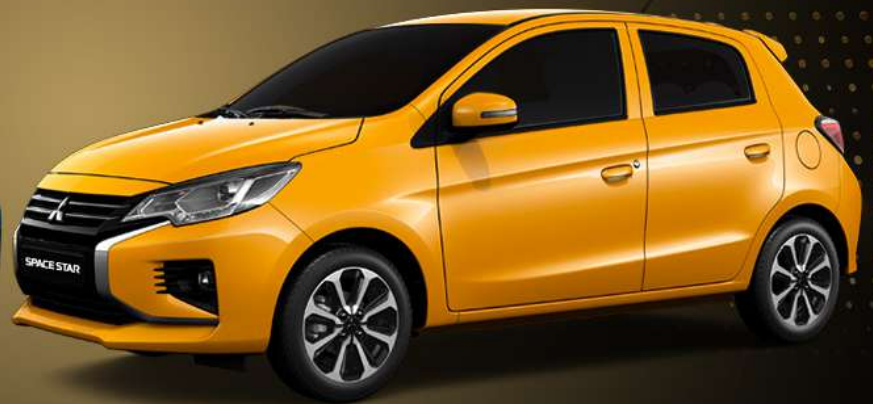
سييس ستار GLX HL