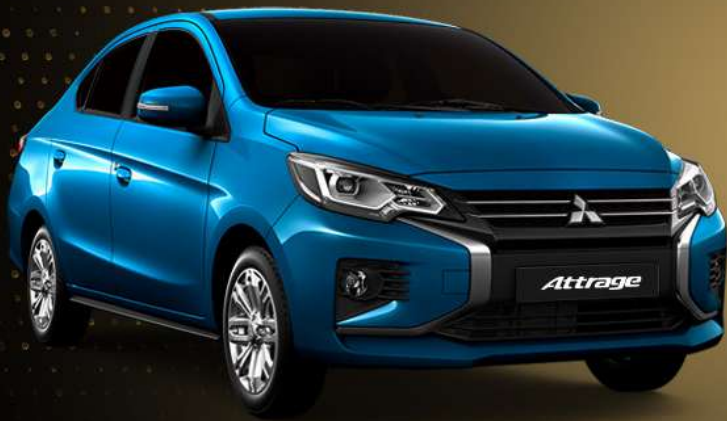
اتراج GLX LL